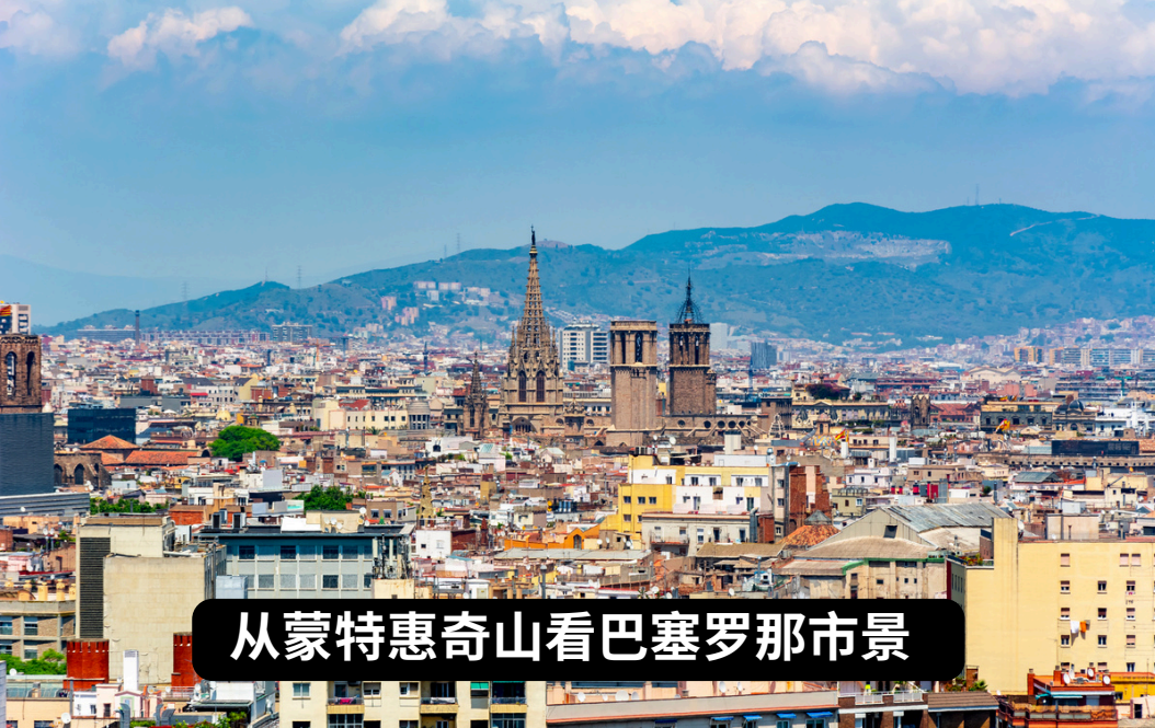
从蒙特惠奇山看巴塞罗那市景