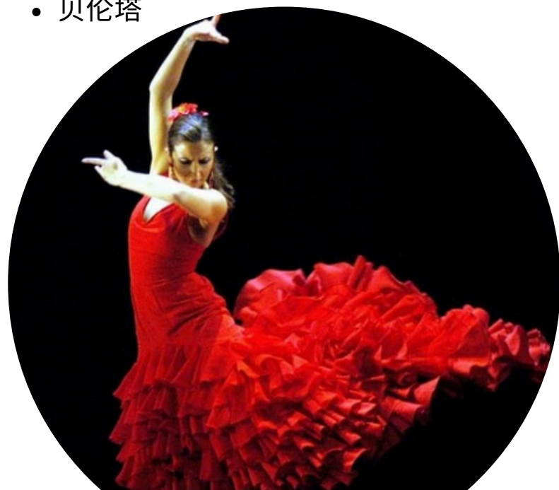
可选弗拉门戈舞蹈表演塞维利亚