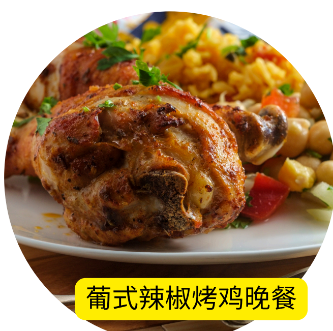
葡式辣椒烤鸡晚餐