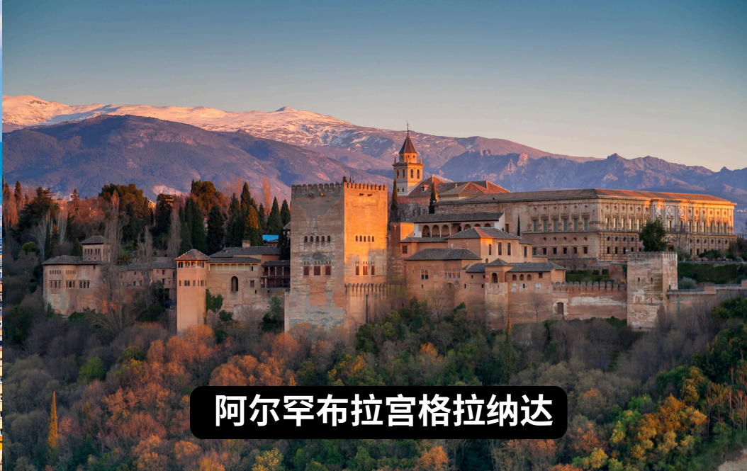
阿尔罕布拉宫格拉纳达