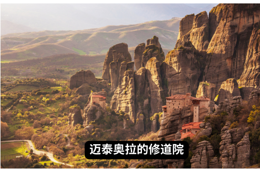
迈泰奥拉的修道院