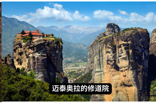
迈泰奥拉的修道院